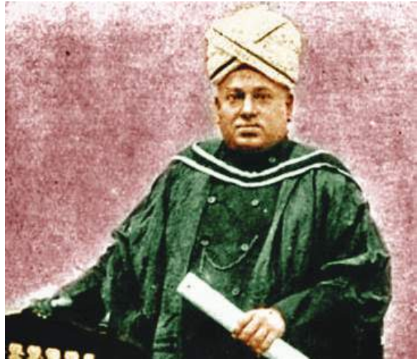
കെ പി പത്തനാമേനോൻ

ഡച്ച് ആധിപത്യകാലത്ത് കേരളത്തെക്കുറിച്ച് എഴുതിയ നിരവധി പുസ്തകങ്ങളും കുറിപ്പുകളും ചരിത്രത്തിലേക്ക് വെളിച്ചം വീശുന്നുണ്ട്. ബാർലഡ്യസ്, ലിൻഷോട്ടൻ, ന്യൂഹോഫ് എന്നിവരുടെ സഞ്ചാരക്കുറിപ്പുകൾ ഇവയിൽ സവിശേഷ പരാമർശമർഹിക്കുന്നു. കൊച്ചിയിൽ 1717 മുതൽ 1723